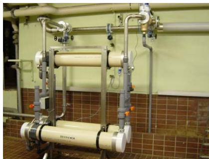
UF 815 B3 C, 21 m 3 /time kaldt vann