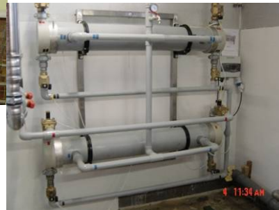
UF 815 B2 H, 16 m 3 /time varmt vann